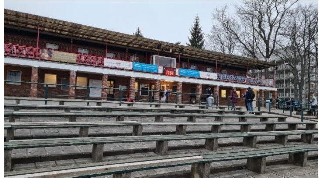
Bis zu 5000 Menschen haben hier Platz.

Der nächste Lauf, letztmalig auf der alten Tartanbahn, wird schon am 06.04. 18 Uhr gestartet. Nach der Sommerpause geht es dann auf der komplett erneuerten Bahn am 19.10.2022 weiter!