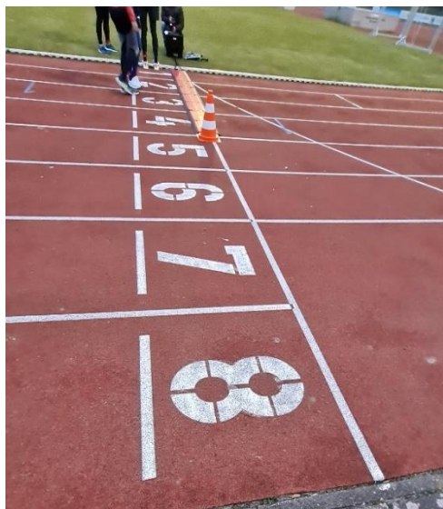
8 Laufbahnen sind Top.