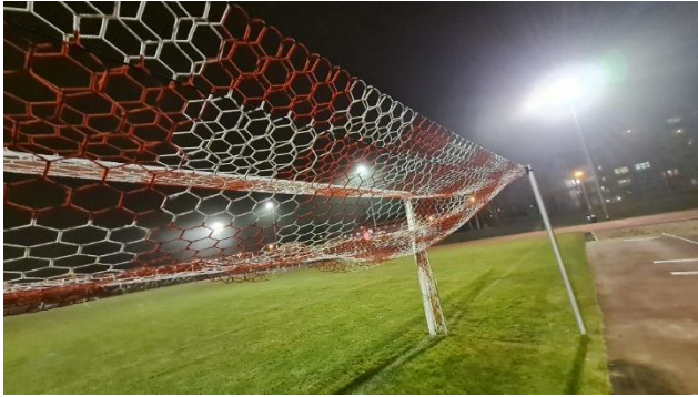
Hier im Volksstadion spielt auch der Greifswalder FC. Aktuell in der Oberliga Nord. Trainer: R. Kroos.